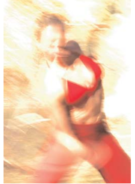
Bewegungsaufnahmen einer Tänzerin, im Freien aufgenommen mit einer langen Belichtungszeit, die für das visuelle Umsetzen der Körperdrehung sorgt.