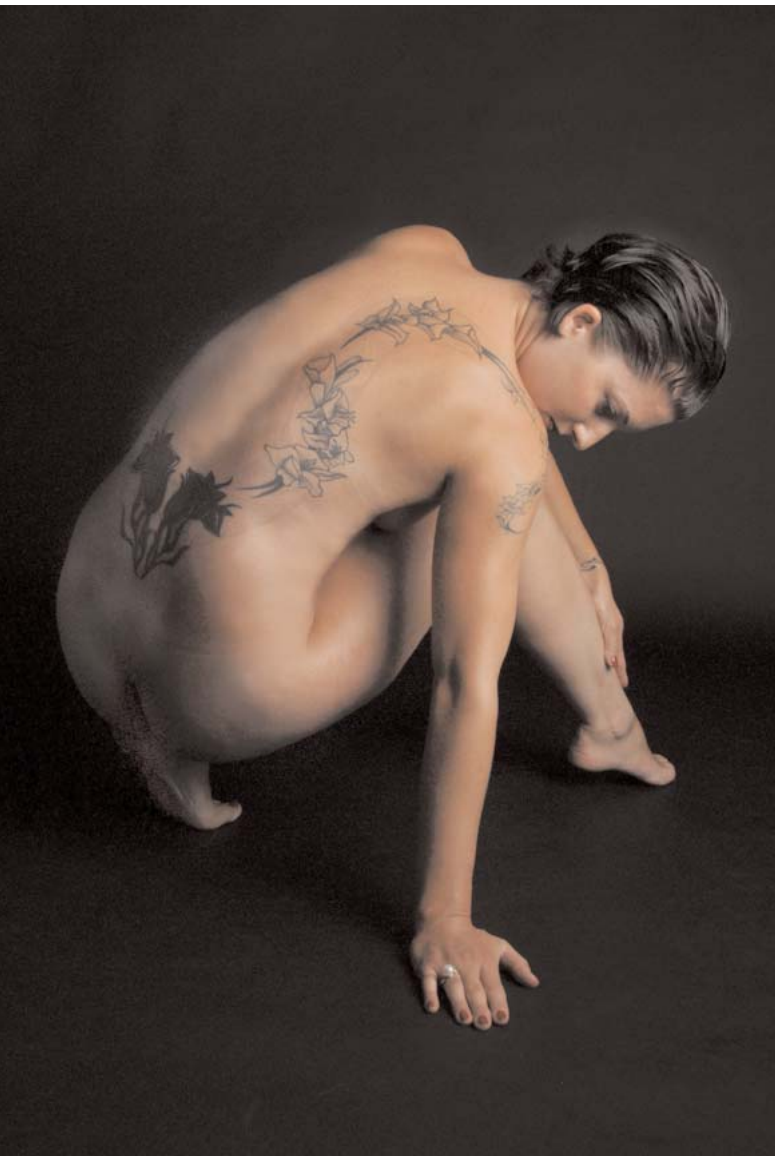
Kunstvolle Tätowierung – künstlerisch inszeniert.

lerei und die Bildhauerei waren während meiner beruflichen Tätigkeit meine Hobbies. Die Fotografie war damals noch mehr Mittel zum Zweck. In dieser Zeit hatte ich dann das grosse Glück Patrizio di Renzo kennen zu lernen und konnte von ihm sehr viel über das Handwerk Fotografie vor der digitalen Zeit und die Bildinszenierung lernen. Die Fotografie begann mich immer mehr zu faszinieren und ich lernte mich immer besser mit dieser Kunstform ausdrücken.