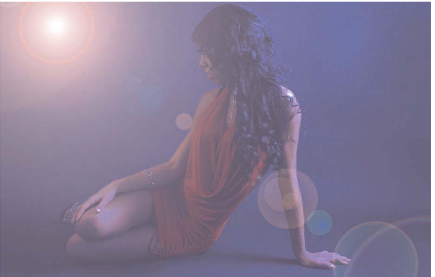
Studio Aufnahme mit sichtbarem Gegenlicht als Stilelement.