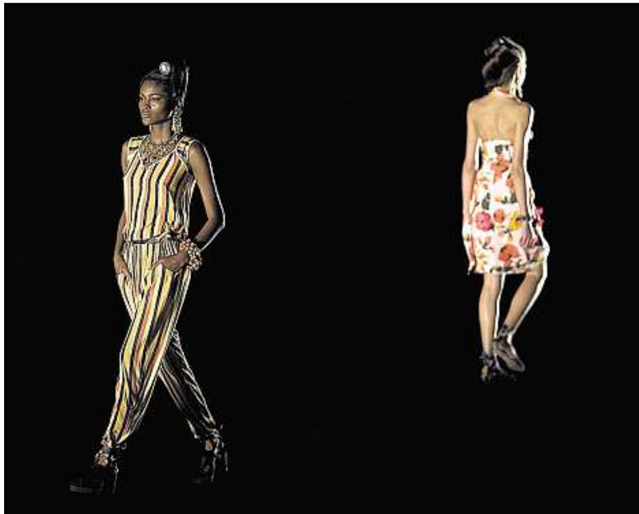
Geht man so richtig? (key)

«Der kleine Coach – Lass los, was deinem Glück im Weg steht». GU Lebenshilfe. ISBN: 978-3-8338-1370-2. Fr. 23.90.